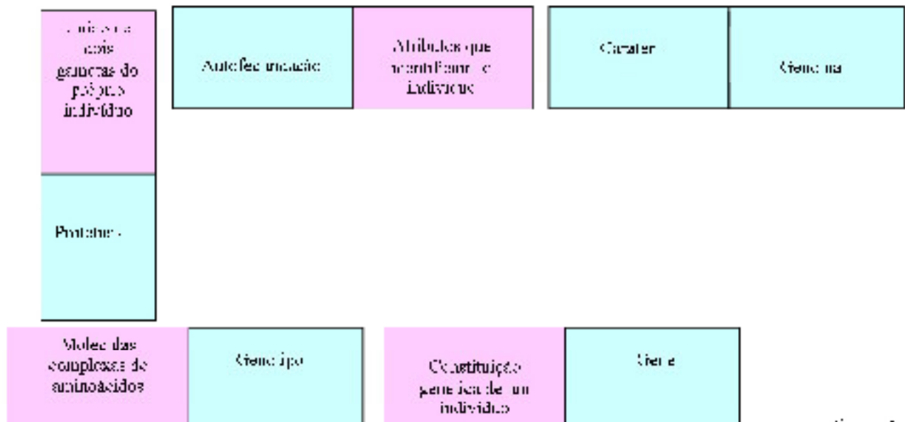
Figura 2. Exemplo resultantes da união