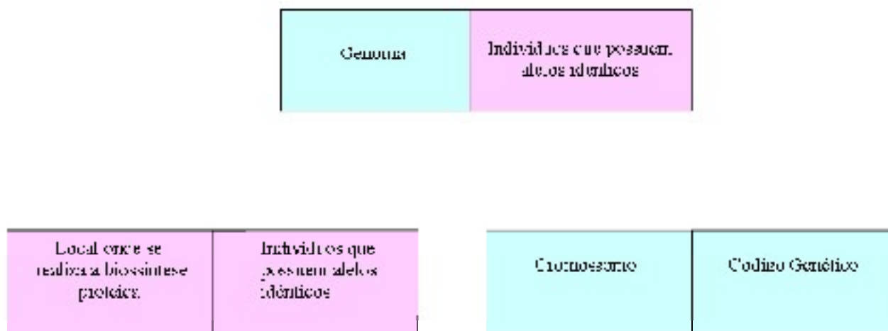
Figura1. Ilustração das pedras do dominó

Nesta proposta, o dominó possuirá 27 pedras, sendo que em 25 destas, como já mencionado, deverão conter em um dos lados uma pergunta e, no outro lado, uma resposta não correspondente (Figura 1). As duas pedras restantes deverão conter em uma delas apenas perguntas em ambos os lados e, na outra pedra, apenas respostas (Figura 1). Sugere-se que cada pedra do dominó seja de tábuas de madeira em tamanho de 4cm de largura x 11cm de comprimento, com uma rachadura no centro, de modo a separar a resposta da pergunta, porém as pedras poderão ser confeccionadas de acordo com o material disponível e a facilidade encontrada na instituição. As perguntas, com suas respectivas respostas, que poderão ser utilizadas neste jogo estão